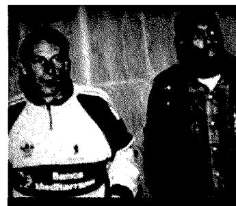
Tra le acquisizioni più rilevanti del passato la Banca Mediterranea (nella foto sponsor del Foggia di Zeman e Roy in serie A)

Il gruppo Banca Popolare di Bari ha effettuato 18 acquisizioni negli ultimi dieci anni, arrivando a circa 1.900 dipendenti